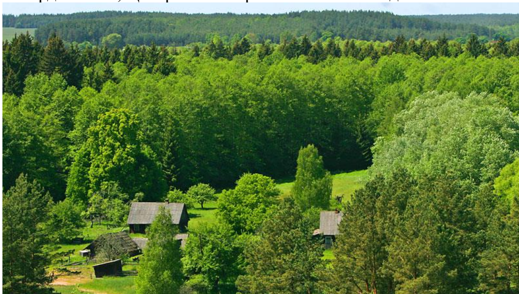
Беларусь. Березинский заповедник.

Базировались партизанские отряды и на территориях Центрально-Лесного, Тебердинского, Центрально-Чернозёмного заповедников.