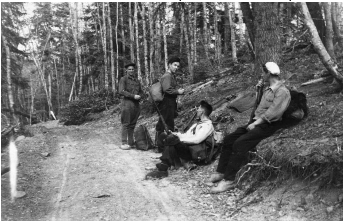
Сотрудники Кавказского заповедника во время маршрута на г.Абаго. 9 мая 1945 г. О победе они узнают лишь по возвращению.

Особо отмечу, что заповедники в годы войны (за исключением полностью оккупированных) в большинстве случаев (были исключения – например, заповедник «Семь островов», «законсервированный» в 1943 г.) не прекращали своей деятельности. Да, сильно сокращались штаты, был острейший дефицит кадров службы охраны (т.к. большинство мужчин были в действующей армии), но работа продолжалась, несмотря на голод, дефицит элементарных вещей и другие лишения военного времени. Так,