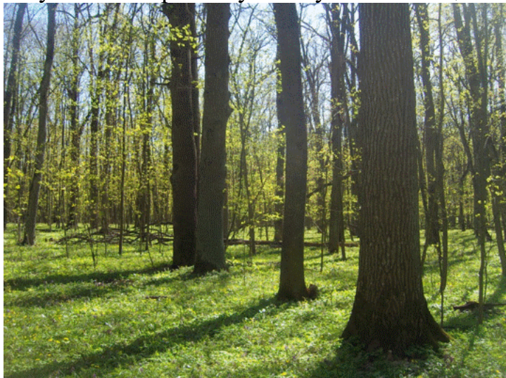
Лес на Ворскле

вступили в Борисовку. Наступил «немецкий порядок».