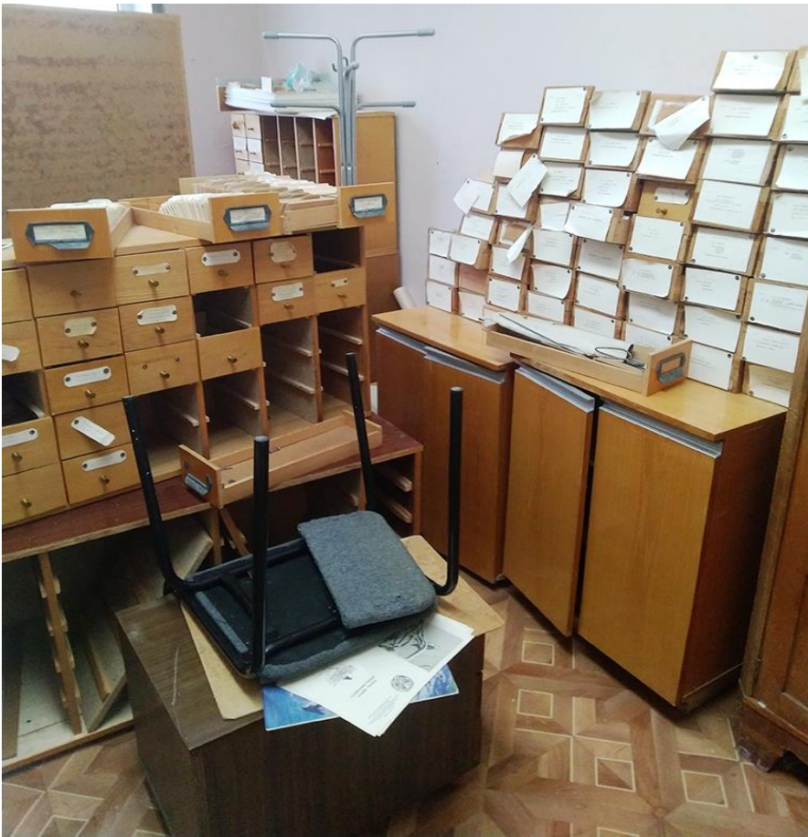
Так хранится карточная информация «базы данных» заповедника.

Электронная база данных, неоднократно упоминаемая в публикациях и отчетах – прекрасно! Что же она собой представляет? Оказывается, это просто таблички в экселе, в которых каждый специалист набивал свои данные, зачастую в разных форматах, и за прошедшие с тех пор десятилетия эти данные так и не были сведены воедино.