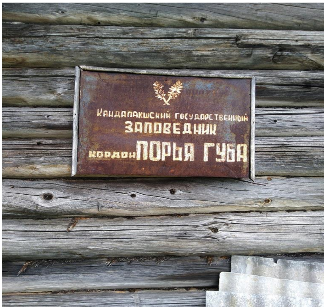
Великолепная иллюстрация состояния всей заповедной системы

только авиатранспортом, расценки на услуги которого многократно превышают стоимость самих блок-контейнеров. Ситуация патовая.