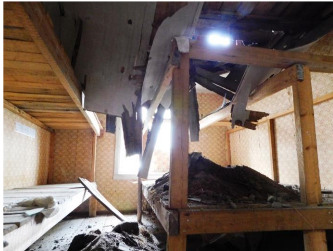
Научная база «Кордон Городецкий» на о. Великий

Ситуация с недвижимым бременем нынешних научных стационаров тоже неоднозначная. С одной стороны, у нас на глазах происходит – а часто уже практически произошла - утрата этих строений. Большинство из них требуют капитального ремонта, на который нет ни денег, ни возможности получить их из федерального бюджета, ни ресурсов у самого заповедника. Там, где научные стационары располагаются в непосредственной близости от кордонов, государственные инспекторы, в меру своих сил и возможностей, в свое личное время пытаются хоть как-то удерживать их от полного разрушения. За это им отдельное спасибо и низкий поклон. Других возможностей у заповедника, учитывая чрезвычайную разобщенность и труднодоступность его участков, просто нет. Рассматривались варианты приобретения современных блок-контейнеров, которые можно установить на научных стационарах в качестве лабораторий и жилых помещений. Проблема тоже оказалась в настоящих условиях нерешаемой: доставка контейнеров на научные стационары возможна