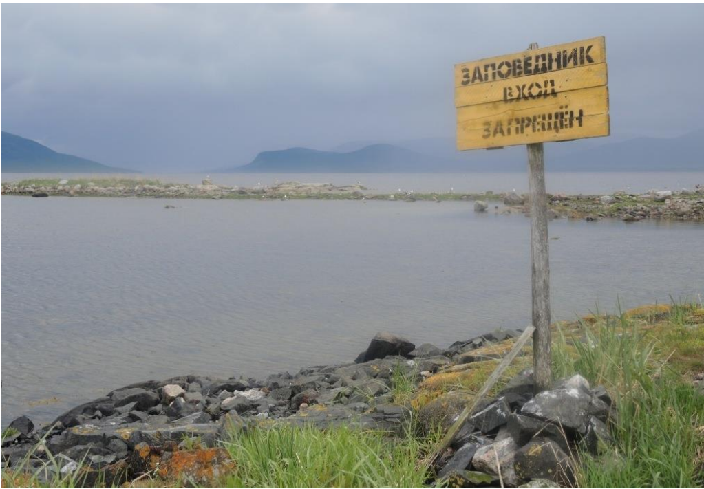
Аншлаг на одном из островов заповедника

На первый взгляд, кажется, что именно исходя из этого благородного посыла и организуются все заповедники: под охрану берутся участки территорий с уникальными фрагментами природы, которые мы сохраняем и изучаем, познавая механизмы действия эволюционных законов на разных уровнях организации и развития. Действительно, часть заповедников создавалась именно так, т.е. как комплексные заповедники (например, Астраханский, Центрально-Лесной, Ильменский). Однако многие заповедники (например, Баргузинский, Кавказский) создавались иначе - для охраны, сохранения или воспроизводства определённого вида, считавшегося полезным для народного хозяйства.