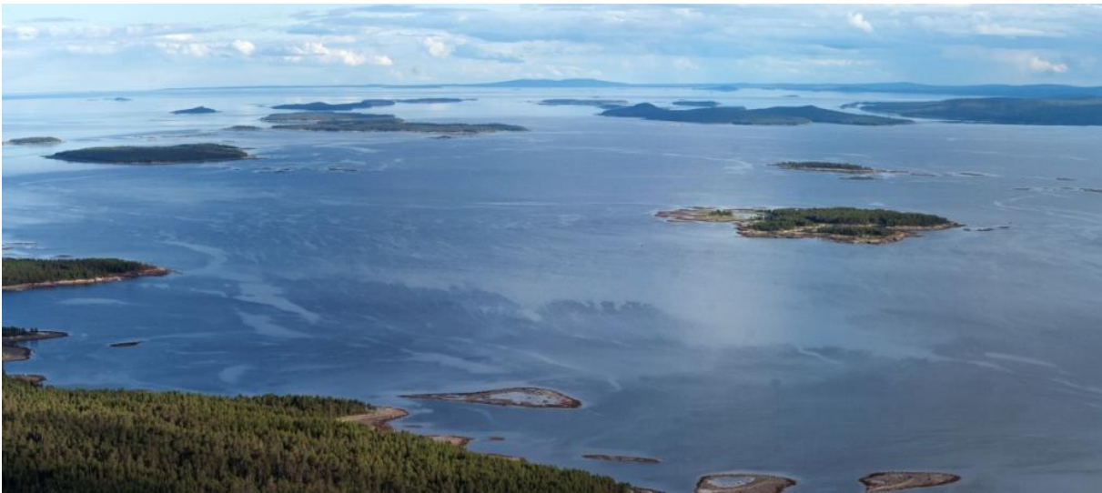
Вид на острова заповедника в вершине Кандалакшского залива

Получается, что в нашем глобальном «заповедном эксперименте» отсутствует «контрольный» образец. Если говорить о территории нашей страны, то девственных участков природы, особенно в сырьевых, индустриальных или сельскохозяйственных регионах практически не осталось. Мы вынуждены восстанавливать историю эволюционных изменений среды на заповедных территориях по опосредованным данным. Задача очень нетривиальная. Исследования эволюционных процессов такого масштаба и сложности на таких территориях требуют серьезной теоретической базы, высококвалифицированного научного персонала и весьма значительного материально-технического обеспечения. Заниматься исследованием такого масштаба глобальных вопросов в состоянии и должна именно академическая, фундаментальная наука, обладающая для этого широчайшими знаниями, возможностями и инструментарием.