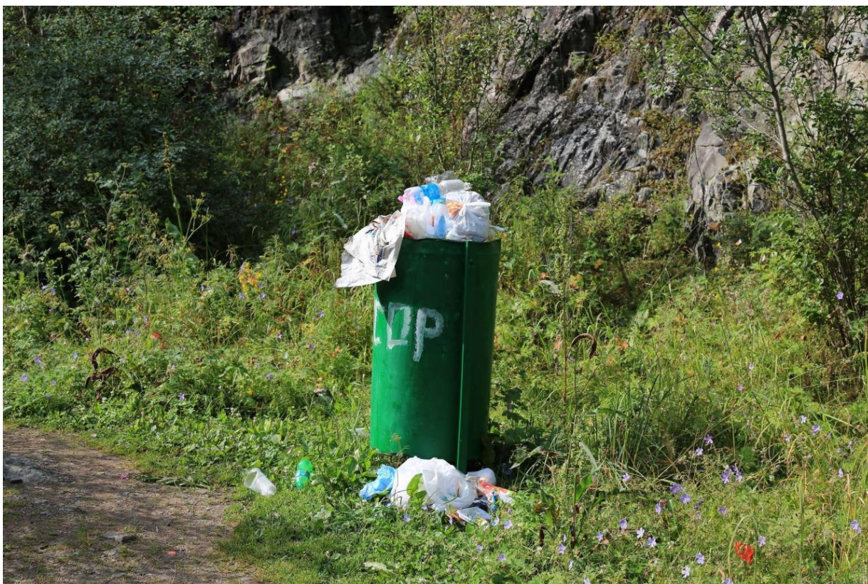
В Тургеньском ущелье

Вот какой ответ был получен на обращение к президенту. Его, обращение, как вы говорите, фактически смыли в унитаз. Я не знаю, какой более яркое сравнение тут можно привести.