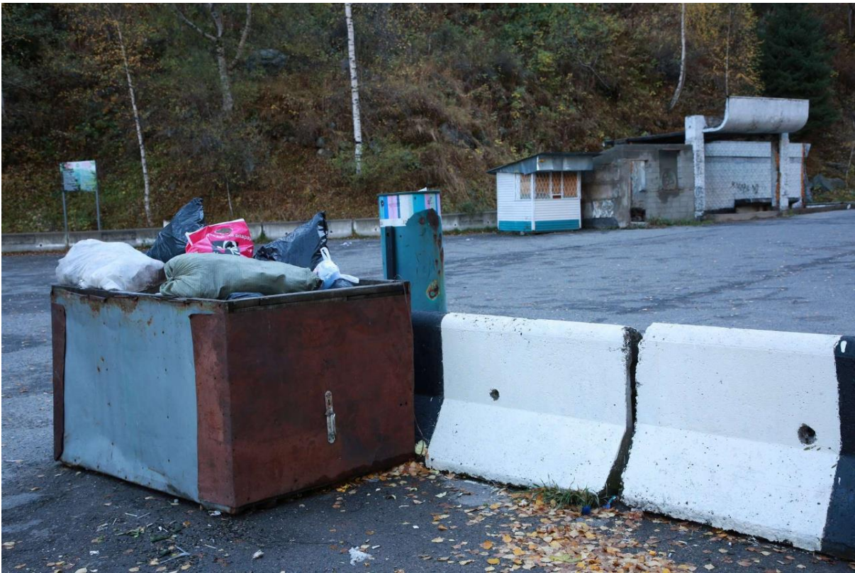
Мусорный контейнер в Большом Алматинском ущелье