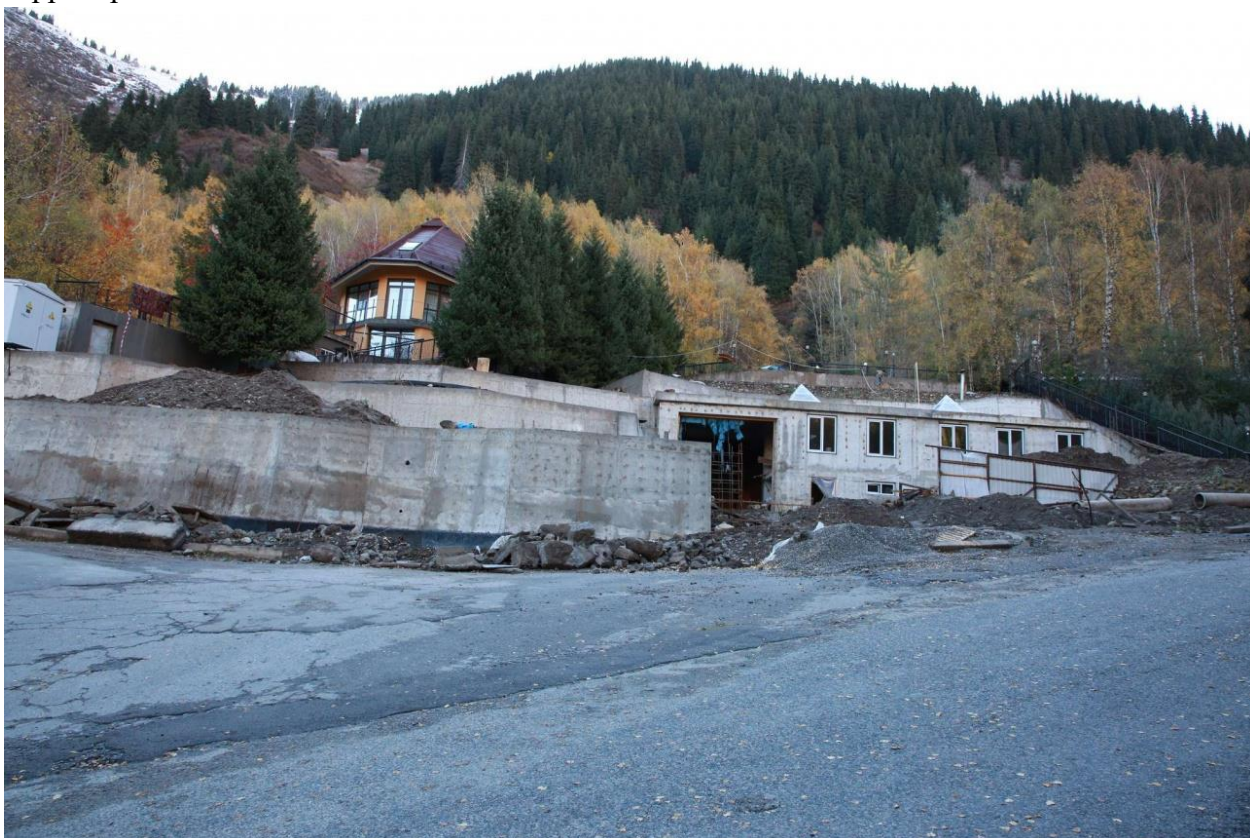
Крепостные стены в ущелье Алма-Арасан

С.К.: Взять урочище Мынжылки – что это, если не опустынивание? Там при строительстве плотины уничтожены склоны, что может спровоцировать оползни. Я допускаю, что нужно было строить плотину, но тогда стройте так, чтобы не разрушать окружающую территорию, применяйте современные технологии, а не просто – выкопали, залили цемент, завалили территорию мусором. Он бы там до сих пор лежал, если б альпинисты скандал не подняли. Мусор увезли, и сейчас там "зона" Тарковского или промзона, но только не особо охраняемая природная территория.