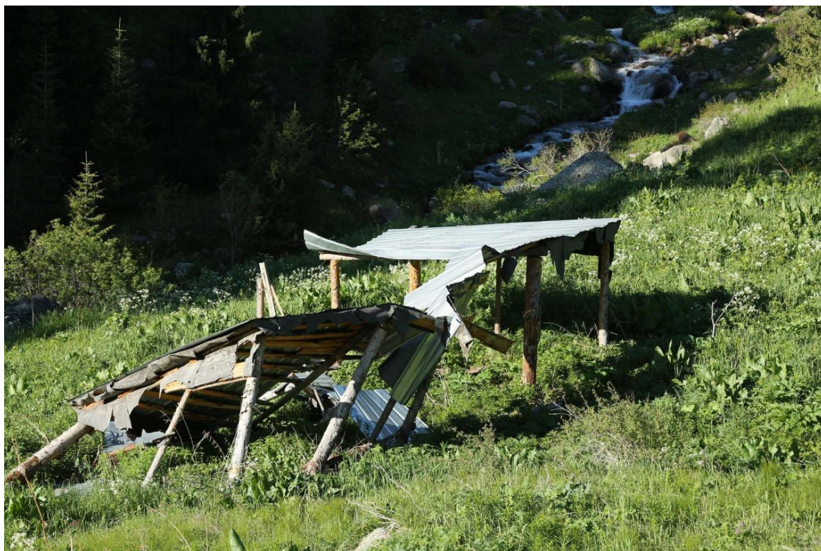
Малое Алматинское ущелье, Горельник

Поэтому любое вмешательство человека приводит к ухудшению экологической ситуации не только на самих этих территориях, но и в городах, которые к ним прилегают, или на соседних территориях. Это выражается в таких явлениях, как опустынивание, экологические катастрофы. В наших горах постоянно случаются оползни и сели, и специалисты считают, что многие из них – результат совершенно бездумного и безумного освоения.