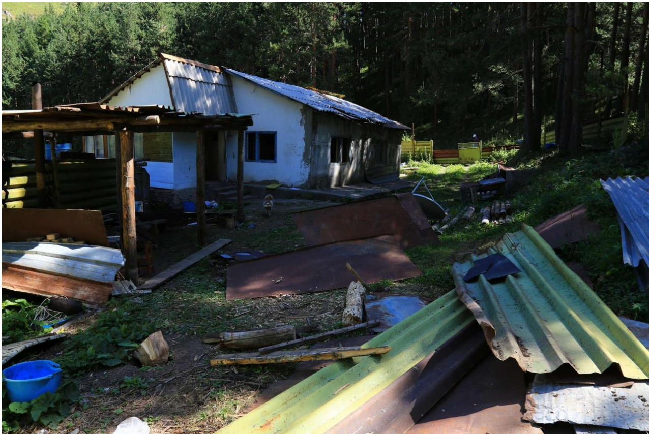
В Кимасаровском ущелье

Что же мы видим в наших национальных парках? Таблички "Частная собственность", "Проход запрещён", заборы, ограды, колючая проволока, собаки на цепи. Это, скорее, похоже на концентрационный лагерь, чем на национальный парк.